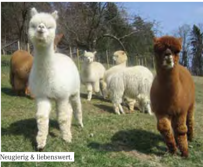
Neugierig & liebenswert.